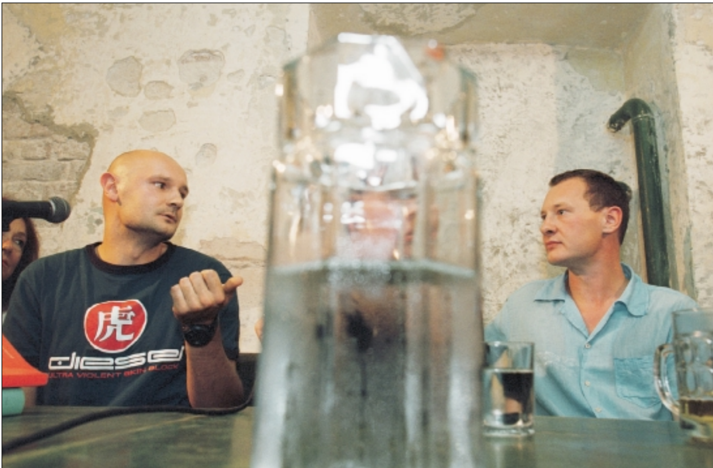
Раньше современным норвежским автором считался Генрих Ибсен. Теперь московская публика познакомилась с молодыми норвежскими писателями...